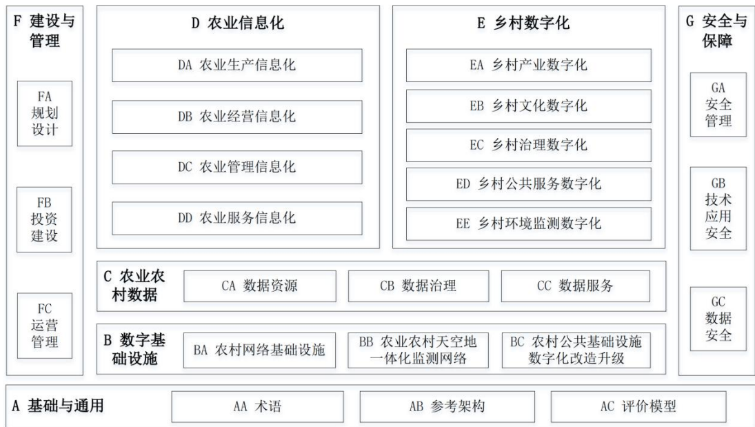
图1 数字乡村标准体系结构

其中，A基础与通用标准主要围绕术语、参考架构、评价模型等方面，为乡村数字基础设施、农业农村数据和应用领域标准提供运作框架。